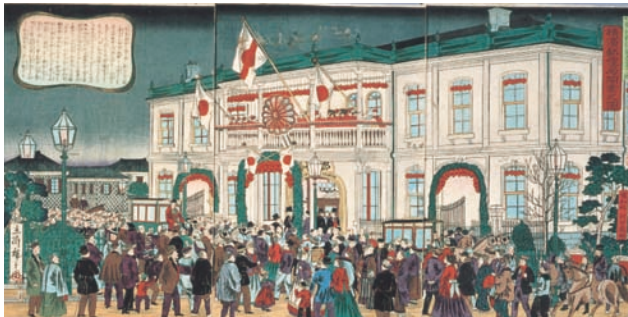
요코하마우체국개업도 삼대 히로시게