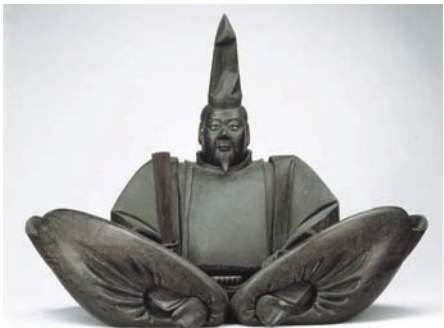
전 미나모토 요리토모 좌상(복제)

각 코너에는 도자기(陶磁器), 카마쿠라조각(鎌倉彫), 수묵화(水墨畵), 불교조각(仏敎彫刻), 석조물(石造物) 등 미술공예품(美術工藝品)을 풍부하게 전시하고 있으며 또 실물대(実物大)로 복원(復元)한 원각사사리전(円覺寺舍利殿)을 설치하여 중세적인 공간을 재현(再現)하고 있습니다.