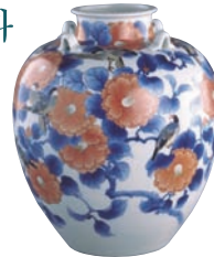
염색 동백꽃 문조 화병 미야기와 쿠히산

쇄국(鎖國)하의 제외국(諸外國)간 교류(交流), 페리 내항(來航), 세계적인 요코하마(横浜)개항장, 가나가와현역(神奈川縣域)의 문명개화(文明開化) 상황(狀況), 자유민권운동(自由民権運動)의 동향(動向), 근대산업의 발달 등 가나가와현 지역의 근대화를 이루게한 특징적인 사상을 주제로 다루고 있습니다. 특히 당대 요코하마의 문화나 풍속을 다룬 요코하마풍속화(横浜浮世絵), 근대화(近代絵畵), 신문(新聞), 고사진(古写真) 등의 자료를 풍부하게 소개하고 있습니다. 또 현재 이 박물관 건물로 전용(転用)되고 있는 요코하마쇼겐은행본점(横浜正金銀行本店, 중요문화재, 1904년에 준공됨)에 관한 자료를 한 코너에 마련하여 이 박물관이 가나가와지역의 근대화에 기여한 역할을 되새겨 볼 수 있도록 전시하고 있습니다.