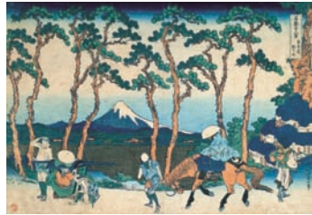
부악삼십육경 동해도 정곡 카츠시카 호쿠사이

근세의 가나가와현역(神奈川縣域)은 대도시(大都市) 에도(江戸)에 근접(近接)한 입지(立地)로 에도와 고우슈(甲州), 신슈(信州)를 연결하는 고우슈도중(甲州道中)의 북부(北部)와 에도와 상방(上方, 현재 京都부근)을 연결하는 동해도(東海道)의 남부(南部)를 통과하고 있었습니다. 그 중에서도 간선로(幹線路)인 동해도에는 성(城)을 중심으로 발달한 도시(城下町), 역참(宿場), 말과 마부를 교체하는 역참(繼立所), 관문(關所) 등, 또한 가도(街道)부근의 서민신앙(庶民信仰)의 영지(靈地)인 대산(大山), 명소구적(名所旧蹟)이 풍부한 가나가와학케이(金沢八景), 에노시마(江ノ島), 카마쿠라(鎌倉), 탕치장(湯治場)의 하코네(箱根) 등이 있었습니다. 그림 지도(絵圖), 지도(地圖), 풍속화(浮世絵), 고문서(古文書), 모형(模型) 등을 전시하여 가도(街道)의 모습이나 시설(施設)의 양상(様相), 북적거린 서민신앙과 명소순례(巡礼), 가도를 받친 마을과 사람들 그리고 에도의 살림을 떠받친 가나가와의 토산물등 근세 가나가와의 특색(特色)을 소개하고 있습니다.