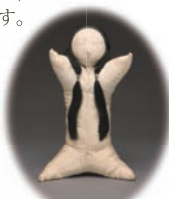
這子 個人蔵(浅原コレクション)