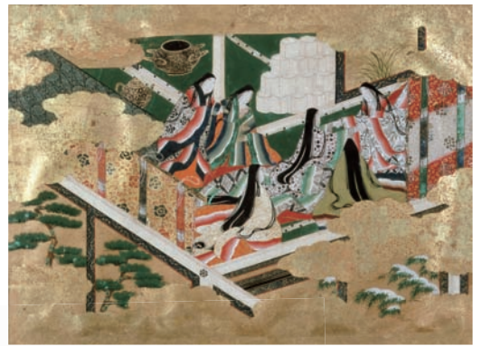
重要文化財 源氏物語手鑑 若菜二 土佐光吉筆 和泉市久保惣記念美術館蔵 【展示期間：10月11日(土)～10月25日(土)】

生命にかかわる場に現れる〈白〉の造形には、どのような祈りが込められていたのか—白一色による表現を選び取った「白絵」という〈かたち〉に注目し、人々の意識の奥底に受け継がれた、祈りと寿ぎの美のあり様を考えていきます。