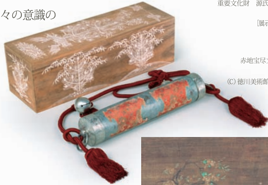
赤地宝尽文錦筒守・白絵松竹鶴亀図筒守箱 徳川美術館蔵 【後期展示】