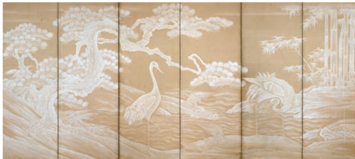
白絵屏風(左隻) 京都府立総合資料館蔵(京都文化博物館管理)