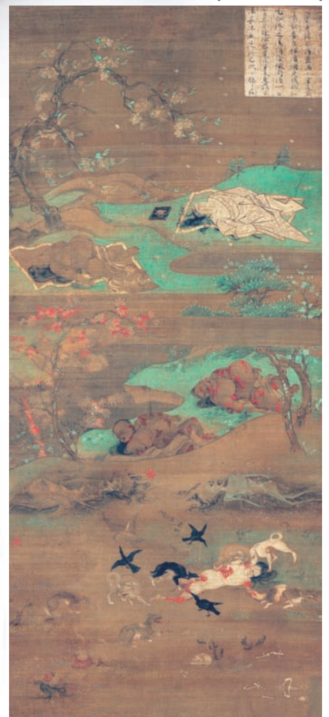
国宝 六道絵 人道不淨相 聖衆來迎寺蔵【展示期間：11月1日(土)～11月16日(日)】

申込先：〒231-0006 横浜市中区南仲通5-60 http://ch.kanagawa-museum.jp/