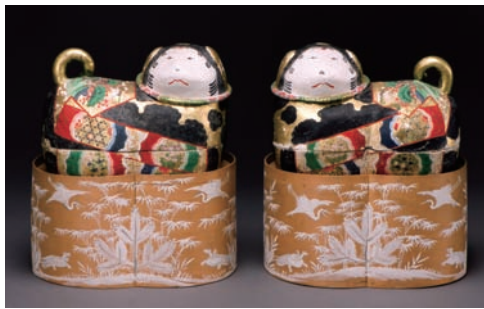
大宮 個人蔵(浅原コレクション)

参加費：無料(ただし、特別展観覧券が必要) / 申込締切：10月4日(土) 必着