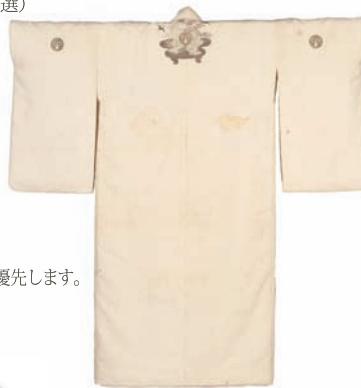
白絹地竹雀紋松竹梅鶴亀銀描袖小袖 仙台市博物館蔵

※1回ごとの申込みも受付致しますが、連続講座のため、全3回お申し込みの方を優先します。