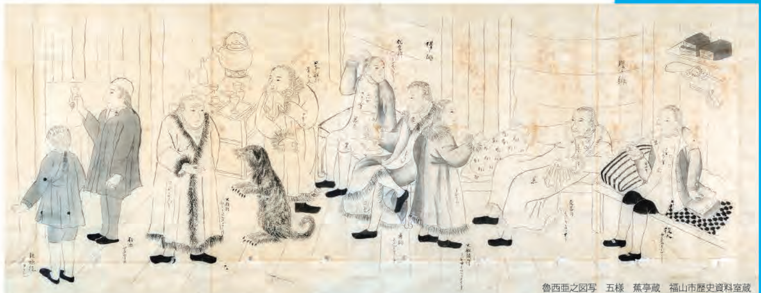
魯西亜之図写 五様 蕉亭蔵 福山市歴史資料室蔵