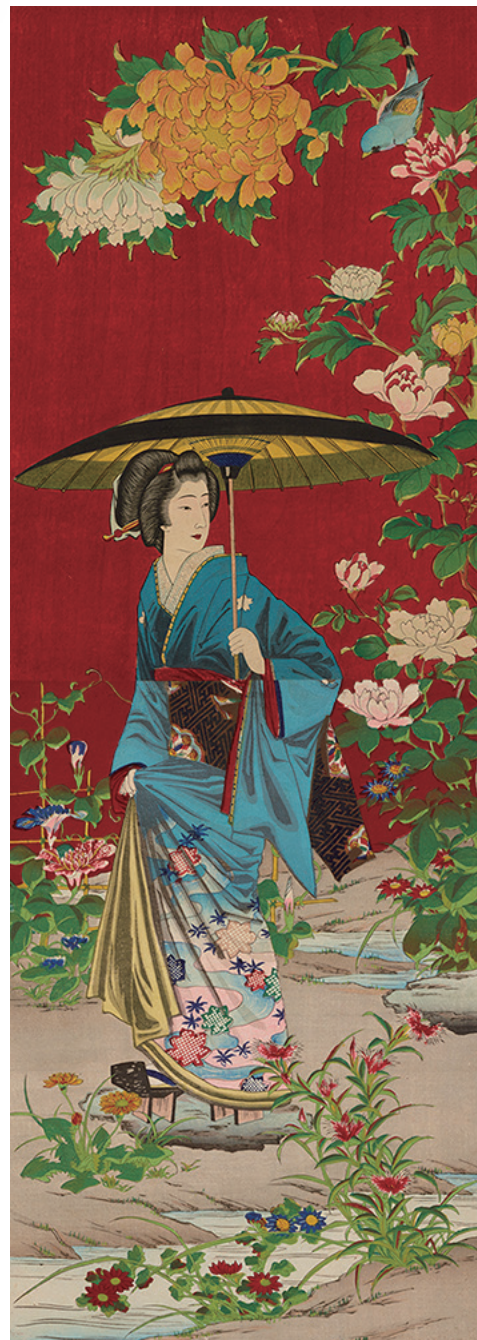
大倉孫兵衛旧蔵錦絵画帖 当館寄託

＝展示構成＝ Welcome zone—近代木版画の粹 Part1—明治錦絵—大倉孫兵衛旧蔵錦絵画帖の世界— Part2—大正新版画—世界が愛した近代の Ukiyo-e—