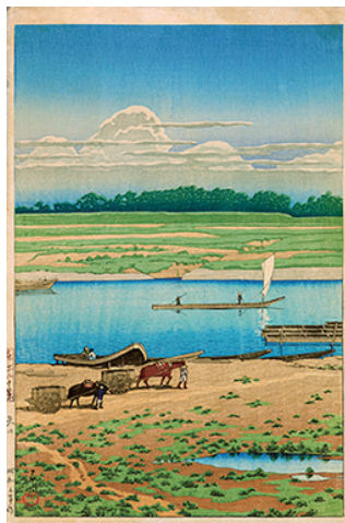
川瀬巴水 東京十二景 矢口 個人蔵