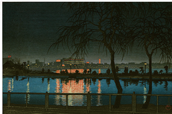
土屋光逸 夜之池畔（不忍池） 個人蔵