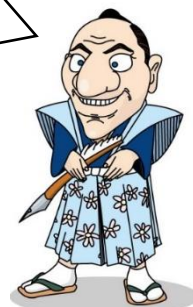
江戸時代の旅のようす

江戸時代、鉄道も自動車もなかったので、旅をするときは、ほとんど歩きだったのじゃ。いまなら東京から京都まで、新幹線で2時間ちょっとでいけるところを、2週間くらいかかったそうじゃ。たいへんだったのう。 さて、歩いて旅をするときに、身につけていた道具が展示されておるぞ。ひとつえらんでスケッチするのじゃ。 スケッチした道具は、なにに使うものかのう。