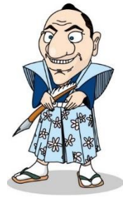
神奈川県立博物館 私設部長 パンチの守

けんがく 見学しながら、ワターシが出すもんだいをといて いくのじゃ。 てんじ ばしょ 展示している場所がわからないとき、ヒントがほ しいときはボランティアさんにきくのじゃぞ。