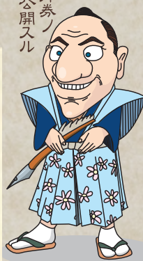
当館キャラクター「パンチの守」