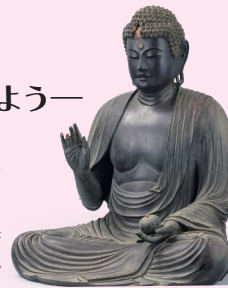
葉師如来坐像 保木葉師堂

横浜には古い仏像はない？そんなことはありません！横浜には飛鳥時代から江戸時代までの仏像がたくさん伝わっており、中には国指定の重要文化財に指定される貴重な仏像もあります。本講演会では、身近な横浜の仏像について神奈川県と横浜市の博物館の彫刻担当学芸員が語ります。お好きな仏像をハッケンしてみませんか？