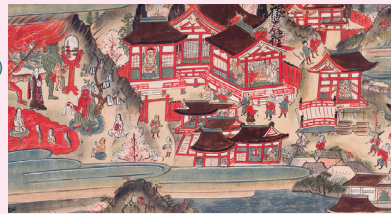
箱根権現縁起絵巻（所蔵：平井節男氏）