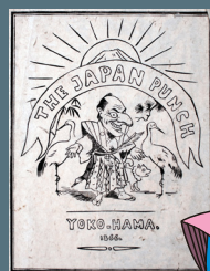
ジャパン・パンチ

かみ 神奈川県立歴史博物館、略して「けんぱく」の営業部長じゃ! 今から160年以上前、イギリスから横浜へ移り住んだチャールズ・ワーグマンという画家がおった。