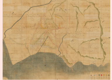
相州鎌倉郡津村腰越村と同国同郡 片瀬村魚獵場出入裁許之事

江戸時代に作られた絵図の中には、裁許絵図（さいきょえず）という、村 VS 村の争論の判決を描いた巨大な絵図があります。神奈川県内に残る裁許絵図を紹介しながら、その特徴と描かれた江戸時代の景観を考えます。