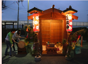
大磯の小正月の様子