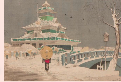
海運橋（第一国立銀行）小林清親（きよちか）