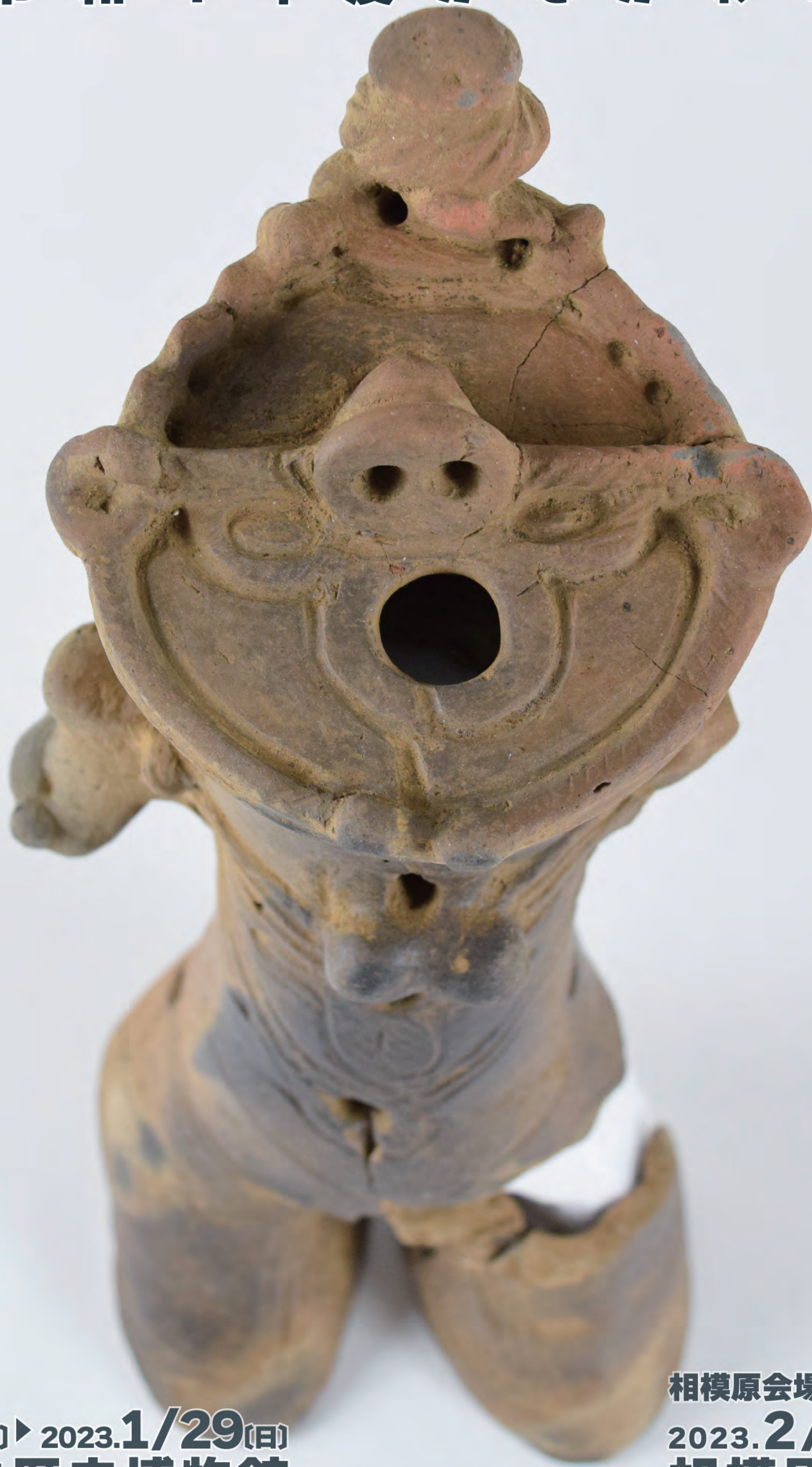
大形中空土偶 秦野市菩提横手遺跡出土