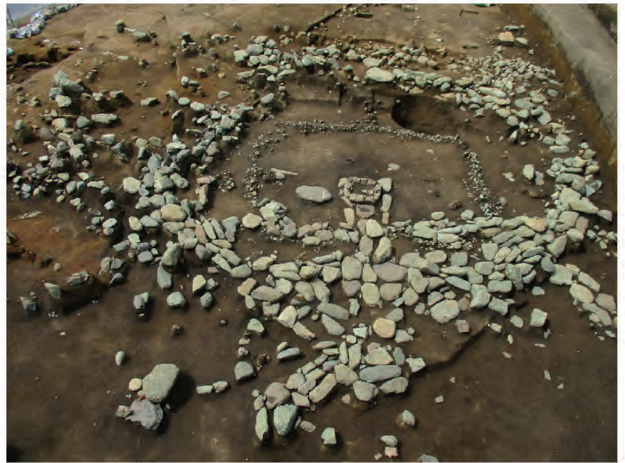
神奈川県秦野市稲荷木遺跡 住居址（縄文時代後期中葉）

中期から後・晩期にかけて、縄文人がどのように環境に適応するための努力をしてきたのか、当時の文化と社会の変化について明らかにします。