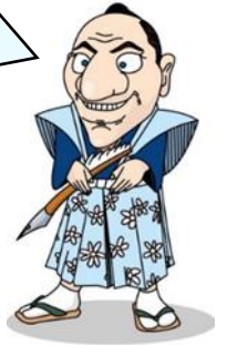
江戸時代の旅のようす

江戸時代、鉄道も自動車もなかったので、旅をするときは、ほとんど歩きだったのじゃ。いまなら東京から京都まで、新幹線で2時間ちょっとでいけるところを、2週間くらいかかったそうじゃ。たいへんだったのう。 さて、歩いて旅をするときに、身につけていた道具が展示されておるぞ。ひとつえらんでスケッチするのじゃ。 スケッチした道具は、なにに使うものかのう。