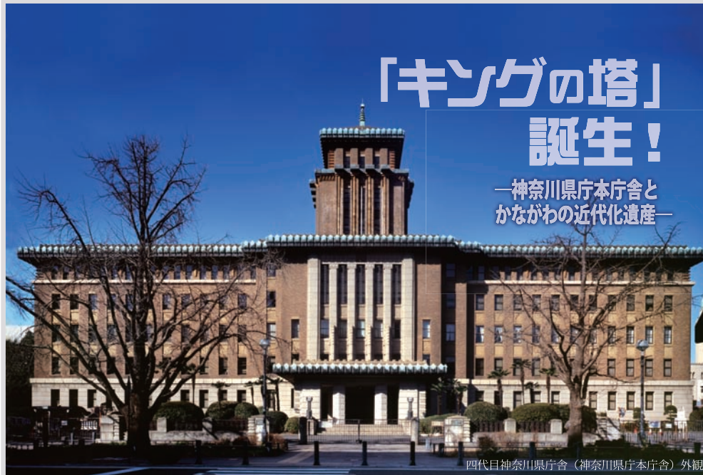
四代目神奈川県庁舎（神奈川県庁本庁舎）外観

横浜三塔のひとつ「キングの塔」として親しまれている神奈川県庁本庁舎は、関東大震災後の1928（昭和3）年10月に竣工した四代目の神奈川県庁舎で、今年秋に創建85年を迎える神奈川県を代表する近代化遺産（近代建築）のひとつです。タイル張りの壁面と独自の幾何学模様の装飾が施された外観はアール・デコ様式を基調としたもので、正面に立ち上がっている建物のシンボル「キングの塔」は、和風の塔や屋根を持つ「帝冠様式」建築の先駆的事例とも言われています。