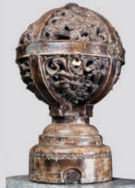
神奈川県庁本庁舎 正面玄関ホール階段の装飾灯

さらに、工場、ホテルや旧軍施設などの神奈川県を特徴づける近代化遺産に関わる資料も展示し、あわせて約150点の資料により、かながわという地域とそこに残された貴重な遺産の魅力を感じとっていただきたいと思います。