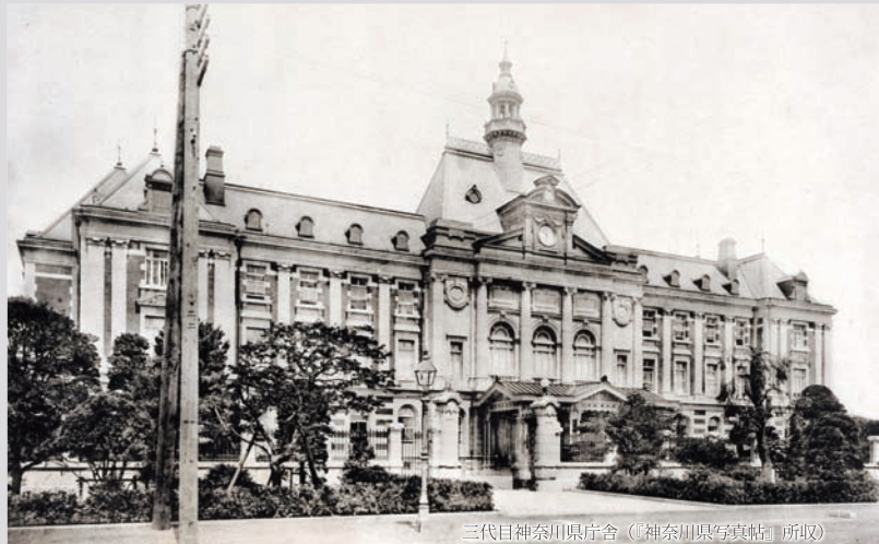
三代目神奈川県庁舎（『神奈川県庁史』所収）