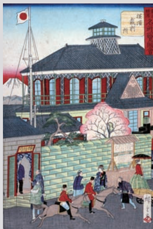
東京横浜名所一覽図会 横浜裁判所