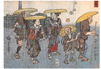
江戸時代の旅のようす